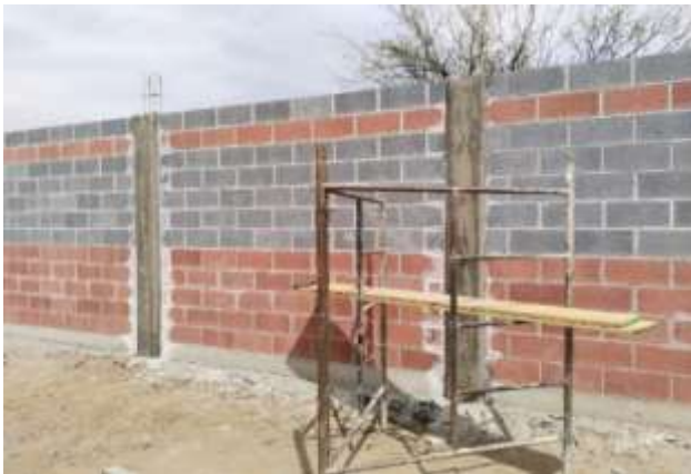
Construcción de barda perimetral en escuela primaria "Ricardo Flores